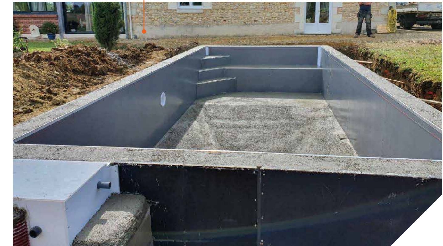
Large gamme d'escaliers monobloc, 30 Modèles standart.